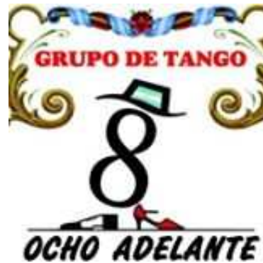
Ilustração 7. Logotipo do grupo 8 Adelante