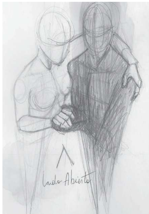
Ilustração 4. Lado aberto do abraço

generosamente, tanto que a mão descansa sobre a escápula esquerda do parceiro [...]" (FALCOFF, 2011, p.168, tradução nossa).